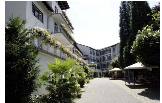
Das Wohn- und Pflegeheim Arienheller

Arienheller 2 56598 Rheinbrohl Tel.: 02635 / 968-0