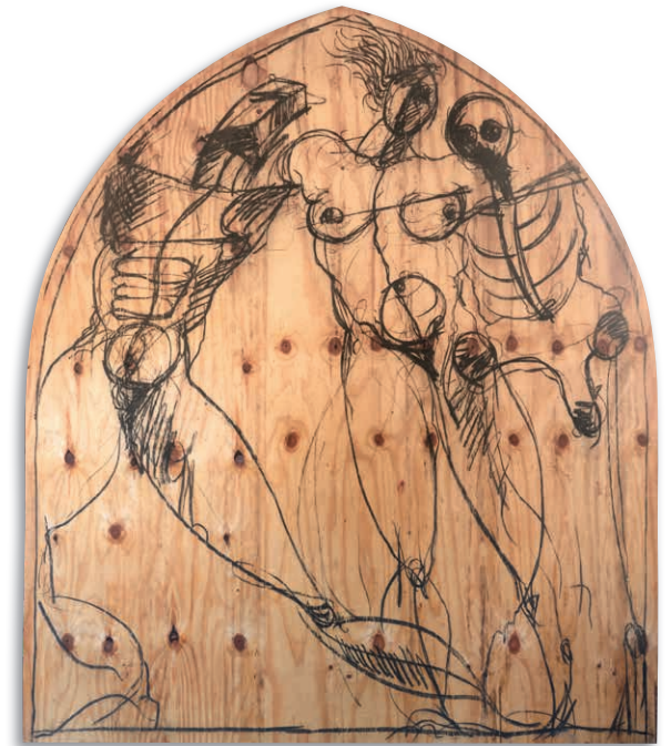
Totentanz , 1997, Kohle auf Holz