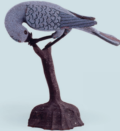
3 Papagei 1755–72 Korallenfabrik van Selow, Städtisches Museum Braunschweig