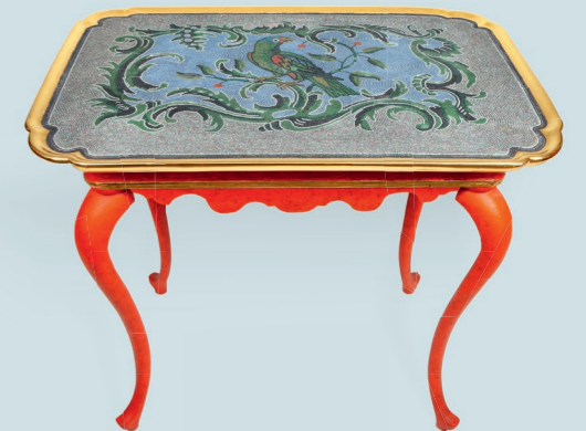
7 Perlmosaik-Tisch 1755–72 Korallenfabrik van Selow, Privatsammlung