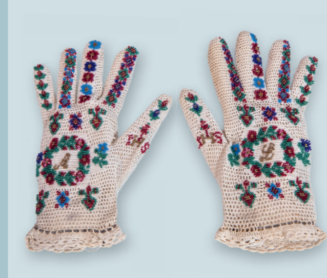
9 Handschuhe mit Glasperlen Ende 19. Jahrhundert, Privatsammlung

Titelbild Perlmosaik-Tisch (Detail der Tischplatte) 1755–72, Korallenfabrik van Selow, Privatsammlung