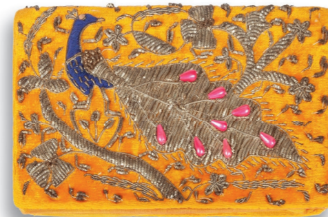
8 Abendtasche mit Glasperlen 1. Drittel 20. Jahrhundert, Privatsammlung