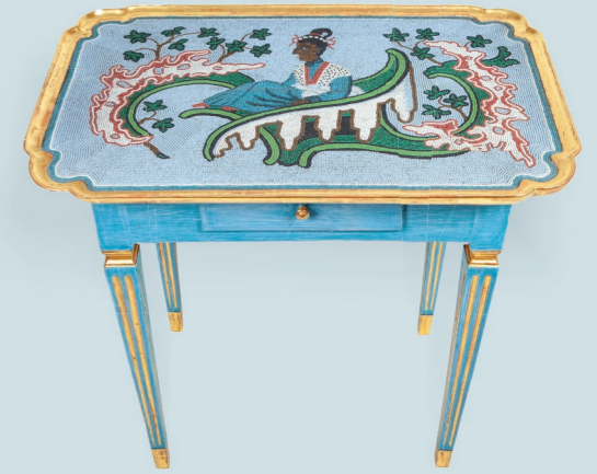
5 Perlmosaik-Tisch 1755–72 Korallenfabrik van Selow, Privatsammlung