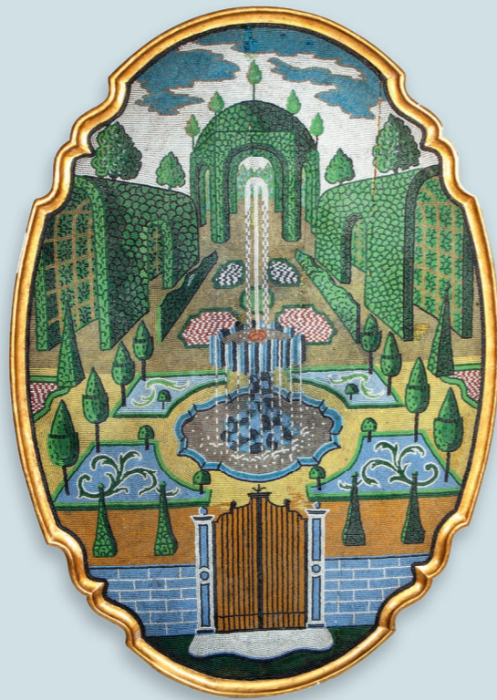
1 Perlmosaik-Tisch (Tischplatte) 1755–72 Korallenfabrik van Selow, Privatsammlung

Es erscheint ein Katalog mit zahlreichen farbigen Abbildungen.