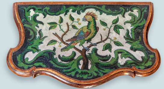
6 Perlmosaik-Tisch 1755–72 Korallenfabrik van Selow, Privatsammlung