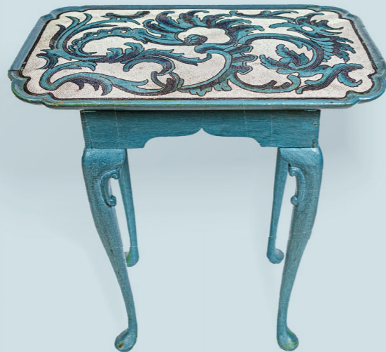
2 Perlmosaik-Tisch 1755–72 Korallenfabrik van Selow, Privatsammlung