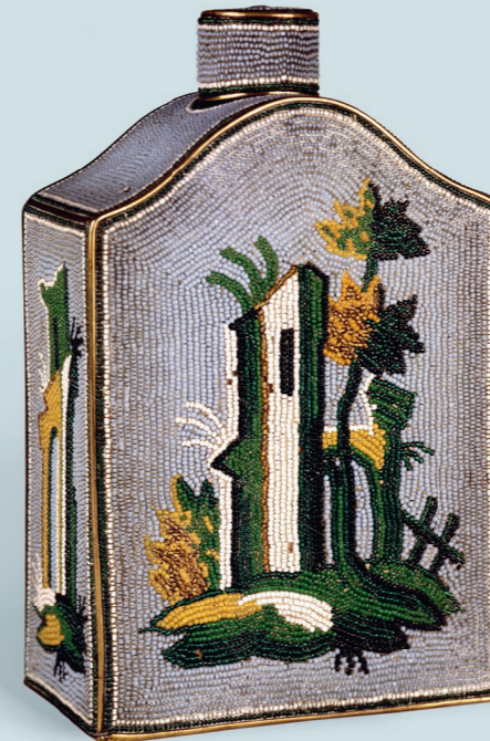
4 Teedose mit Glasperlen 1755–72 Korallenfabrik van Selow, Städtisches Museum Braunschweig